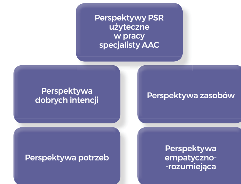
Ryc. 2. Wybrane perspektywy PSR użyteczne w procesie współpracy z rodzinami

VIT (Videotrening Komunikacji, Video Interaction Training). Krótkoterminowa metoda pracy z systemem rodzinnym oparta na materiale wideo nakręconym w domu. Została opracowana w latach osiemdziesiątych XX w. przez grupę holenderskich psychologów i pedagogów. Początkowo była wykorzystywana tylko jako wsparcie rodziców doświadczających trudności w wychowaniu swoich dzieci. Obecnie jest użyteczna również w obszarach edukacji, pedagogiki specjalnej, w placówkach opiekuńczych. Znajduje zastosowanie we wprowadzaniu zasad udanej komunikacji w zarządzanie i organizację w różnorodnych instytucjach. Centralną rolę w tej metodzie odgrywa analiza pozytywnych obrazów i elementów udanych interakcji. Sposób pracy trenera VIT jest skoncentrowany na rozwiązaniu.