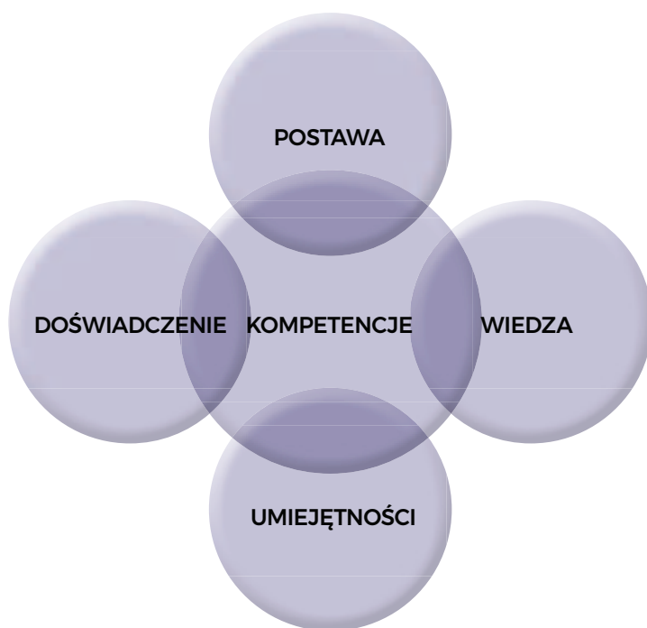
Ryc. 1. Składowe kompetencji